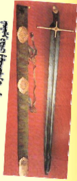
تشیرو دنگانی پيغمبري خوي بيگانه گان ستر ندم

بسم الله الرحمن الرحيم الحمد لله رب العالمين الذي هدانا لهذا لم كنا لنهتدي لولا ان هدانا الله والحمد لله رب العالمين